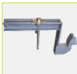
Support pour la fixation de la plate-forme SAFTEC® depuis la partie supérieure de la dalle (sans mur).