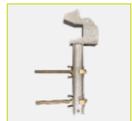
Support pour la fixation de la plate-forme SAFTEC® par le dessous des dalles.