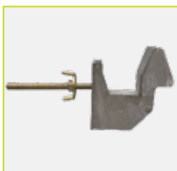
Support de fixation conventionnel de la plate-forme SAFTEC®.